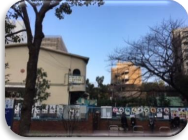
後楽地域の再開発

小石川運動場南側敷地を使って、今年4月に 私立認可保育園 が 新規開設 することになりました。こうした区有地の積極的な活用を提案しています。平成31年度は、 区立第一中学校 内に私立認可園が開設予定です。