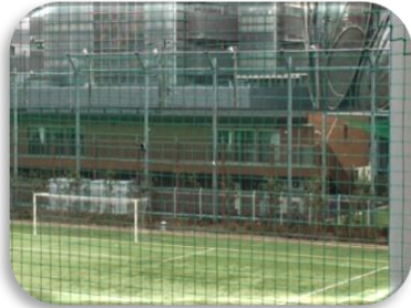
小石川運動場 南側