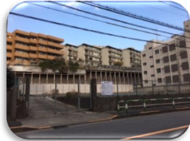
春日2丁目国有地（建設省官舎跡地）

国と文京区で後楽地区エリアマネジメント構想が本格的に動き出します。老朽化した 清掃事務所 建替えと 後楽幼稚園 を「 こども園 」にと要望しています。合同庁舎の建設に向け、平成30年度から設計に入ります。