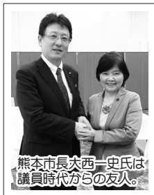
熊本市長大西一史氏は議員時代からの友人。

私は、今年も元気に活動させていただきます。昨年は、熊本地震で被災した熊本市、益城町などに直接出向き被災者の声を通して文京区の災害対策を見直す作業を行いました。本年も、まずは現場調査と区民の皆さんのご意見をしっかりと聞きし、時代や区民ニーズにマッチした新たな政策提案をしてみたいです。